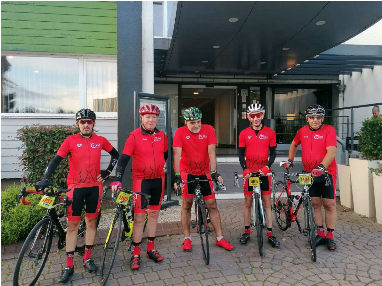
Les Partants du 145KM