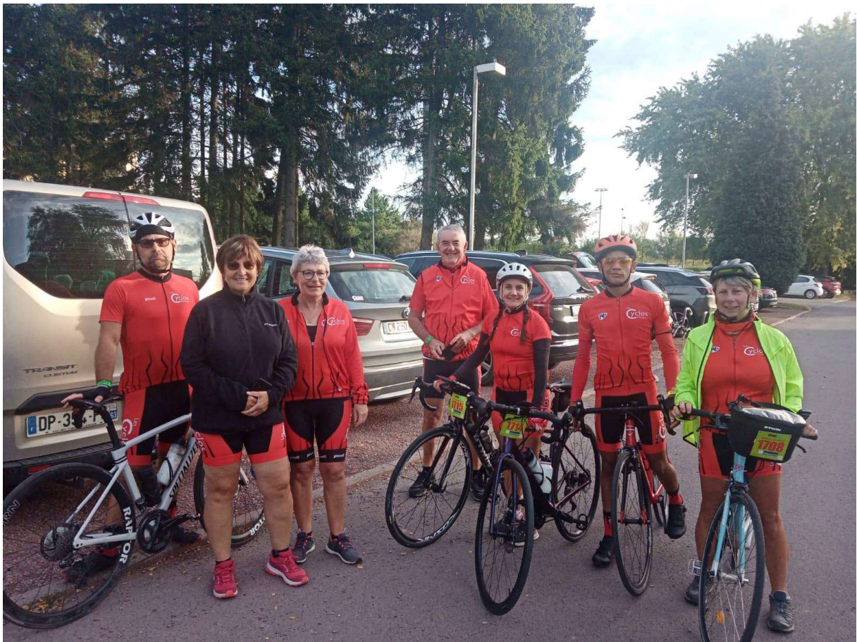
Les Partants du 80KM