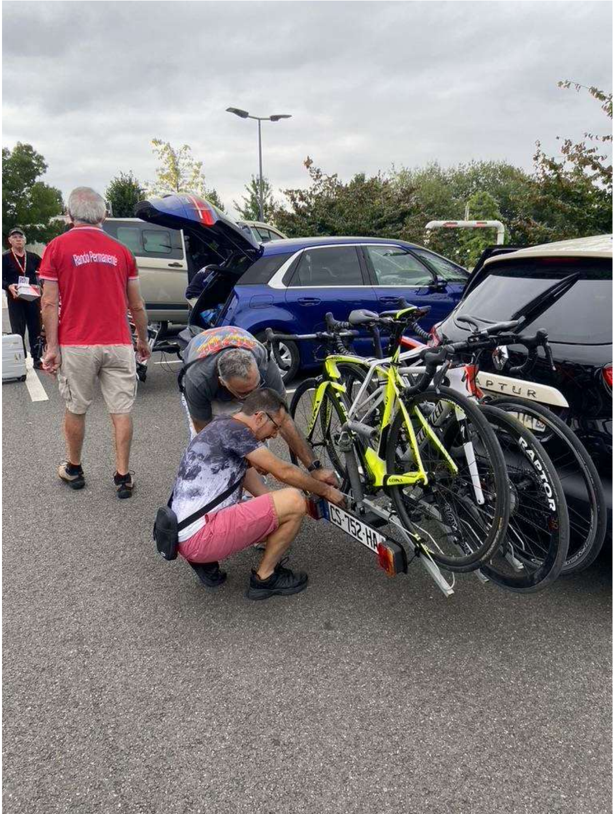
Derniers réglages avant de partir...