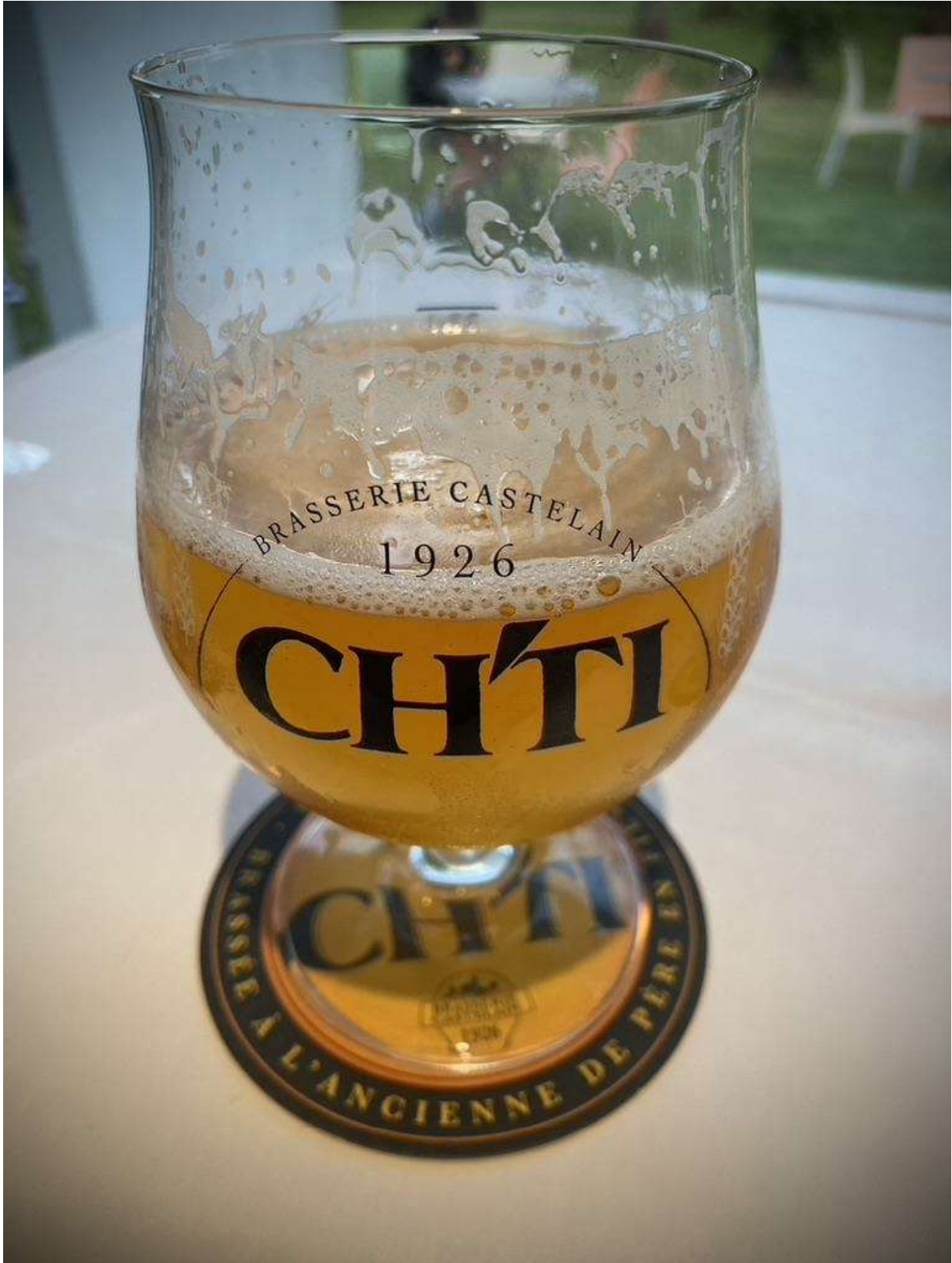
La fameuse bière du Nord : la Ch'ti !!!